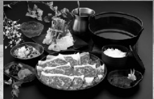
△昼食「ご当地 信州和牛しゃぶしゃぶ」(イメージ)

●対象 象 浜松商工会議所共済制度(プラタナス共済・従業員退職金共済・経営者年金共済)の加入事業所の事業主(役員)及び加入従業員とその家族に限り、1事業所につき4名を限度とさせていただきます。(学生・児童の参加はNG) ※席の効率上、誠に勝手ながら2名、4名(偶数)でのお申込みをお願いします。