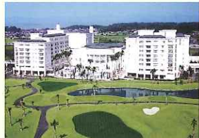
リゾートトラスト(株)エクシブ浜名湖