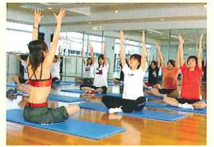
遠鉄スポーツクラブ「エスポ」

当所配布の利用券を「エスポ」に提出し、施設利用料として「espo I」400円、「espo II」800円、「espo袋井」500円を別途お支払いください。一部有料のものを除きご利用いただけます。