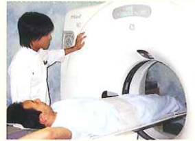
沖健康クリニック

「健康パスポート」を発行いたします。 浜松商工会議所6階の健康相談室「沖健康クリニック」にて健診時に提出すると、人間ドックの健診料金がさらに割引されます。 割引額:1事業所につき2,000円(健診者数1～5名)から最大20,000円(健診者数41名以上)